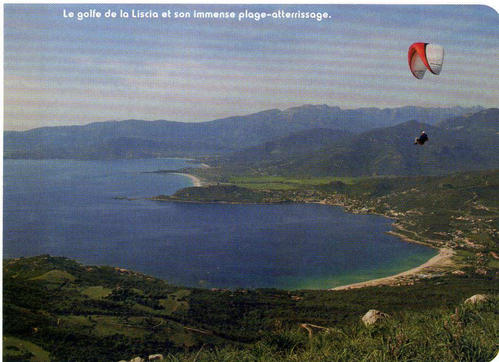
Le golfe de la Liscia et son immense plage-atterrissage.

A DEUX PAS D'AJACCIO, VOLER À SAN BASTIANO, C'EST COMME UN AVANT GOÛT DU PARADIS DU VOL LIBRE : LE VOL SE MÉRITE MAIS IL EN VAUT LA PEINE !